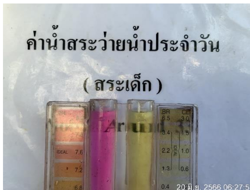
รูปที่ 3.5.3-2 การตรวจวัด pH, Cl 2 สระว่ายน้ำ