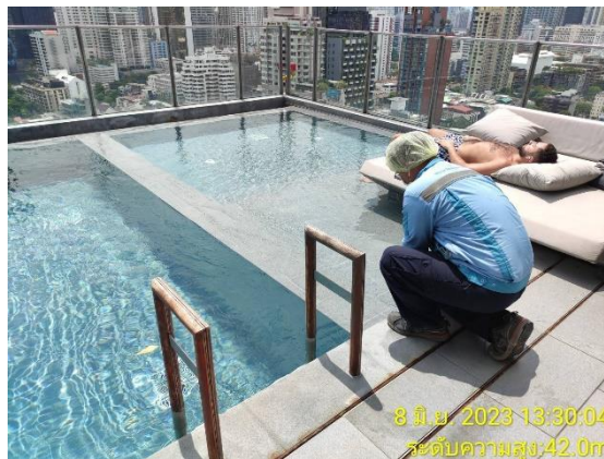
รูปที่ 3.5.3-1 การเก็บตัวอย่างน้ำบริเวณสระว่ายน้ำ