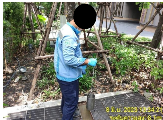
รูปที่ 3.5.5-1 การเก็บตัวอย่างน้ำของระบบบำบัดน้ำเสีย